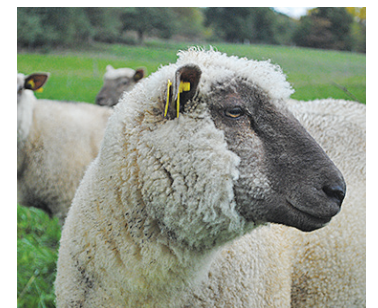
■ Une technique pour des luttes naturelles de printemps peu mise en œuvre.

La période de jours courts (60 jours minimum) se fait ensuite naturellement pour des mises en lutte avant le 15 avril. Les brebis peuvent donc être remises à l'herbe car la durée du jour ne dépasse pas 12 heures. Des durées de lutte de trois cycles semblent plus prudentes selon les résultats disponibles car le premier cycle est peu fécondant (effet mâle). Attention, pour des mises en lutte après le 15 avril, un ajout de mélatonine ou bien l'obscurcissement de la bergerie (souvent difficile à réaliser) est obligatoire. Par exemple, pour une mise en lutte au 1 er avril au 25 mai, les brebis sont en bergerie du 8 novembre au 27 janvier. Elles sont alors en jours longs avec 16 heures de lumière. Puis, du 28 janvier au 1 er avril, elles